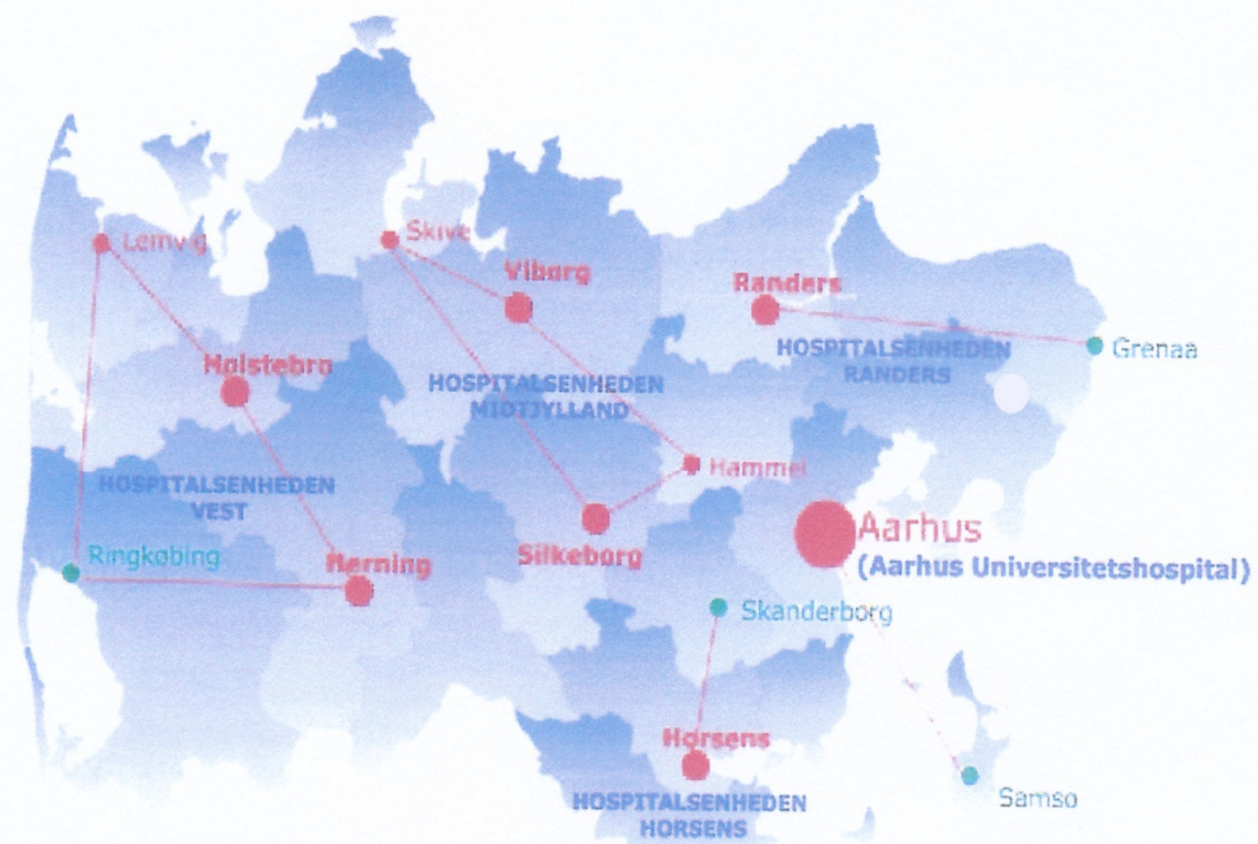
Region Midtjylland 2012