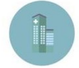
PSYKIATRI OG SOCIAL