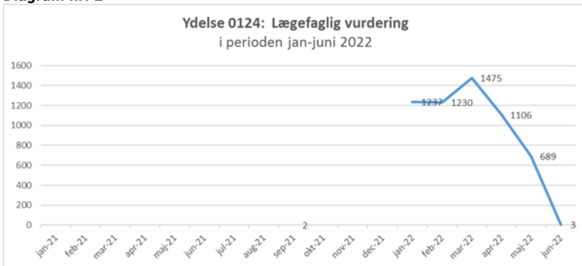
Diagram nr. 2

Note: Afregningsdata for juni 2022, må forventes at være mangelfuld, på tidspunktet for dataudtrækket (30. juni 2022)